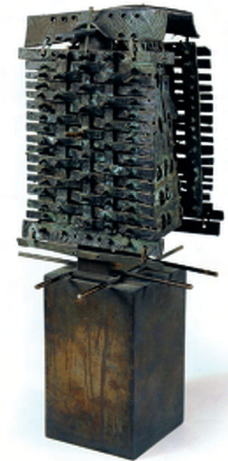
RAINER KRIESTER (Samurai, Unikat, Bronze dunkel patiniert, 58 x 27 x 28 cm, 1979) (Foto: J. Querbach)