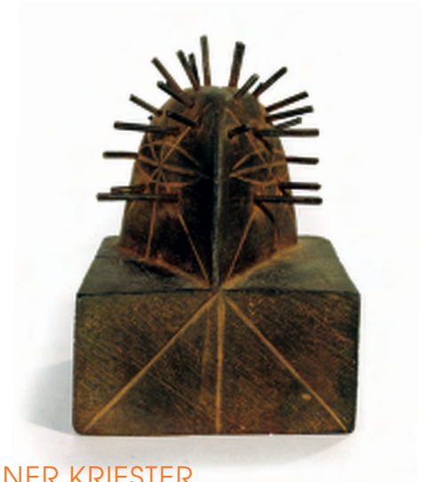
RAINER KRIESTER (Nagelkopf VI, Eisenguss, 15 x 10,5 x 11 cm, 1993/94)