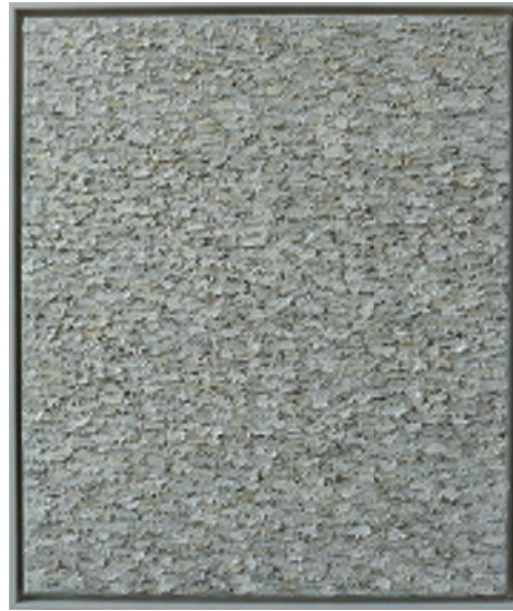
DAN HEPPELLE (o. T., Öl auf Leinwand, 60 x 50 cm, 2009)

AUSSTELLUNGSDAUER: 13. März bis 24. April 2011